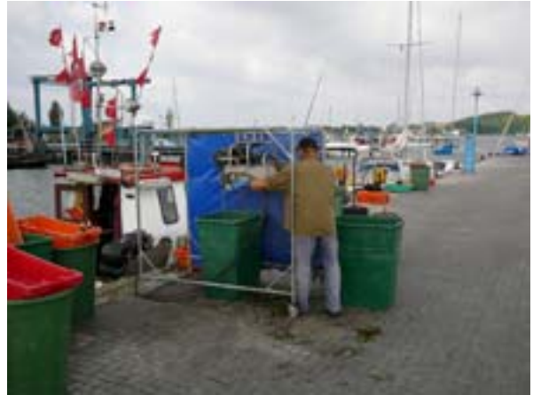
Maandag 31 juli – Thiessow – wind!!! (landdag)

Goeie wind, eindelijk. Dilemma, zeilen of toch wat van het landschap gaan zien. We tellen onze knopen en besluiten toch te gaan fietsen, als het vandaag waait, waarom zou het dan morgen ook niet kunnen waaien.